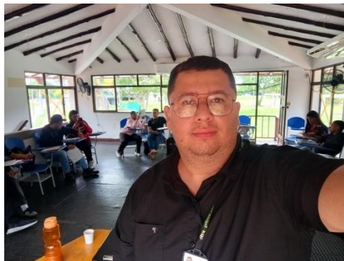
Registro Fotográfico en la Ficha 3452731