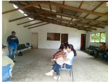
Registro Fotográfico en la Ficha 3473723