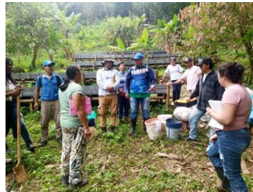
Registro Fotográfico en la Ficha 3488950